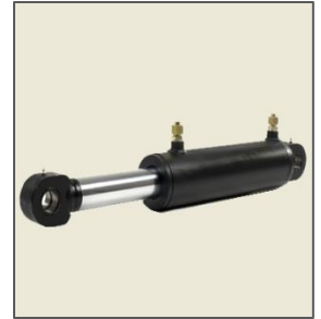
Double Acting Hyd. Cylinder / Double action Hyd. Cylindre Hidrogeração Dupla Cilindro / Hidratación de doble efecto. Cilindro