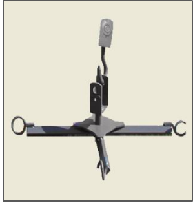
Anchor for Big-Bag / Ancre pour Big-Bag / Âncora para Big-Bag / Ancla para Big-Bag