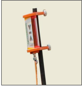
Telescopic Mast / Mât télescopique / Mastro telescópico / Mástil telescópico

Twin Tyres (optional) / Pneus jumelés (optionnel) Pneus duplos (opcional) / Neumáticos gemelos (opcional)