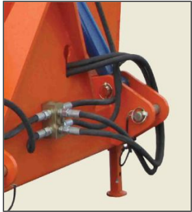
Hydraulic Hose Pipe / Tuyau hydraulique Tubo de Mangueira Hidráulica / Tubo de manguera hidráulica