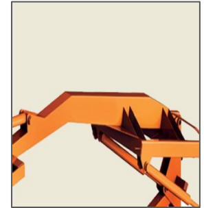
Robust Main Boom / Bras principal robuste / Lança Principal Robusta / Pluma principal robusta