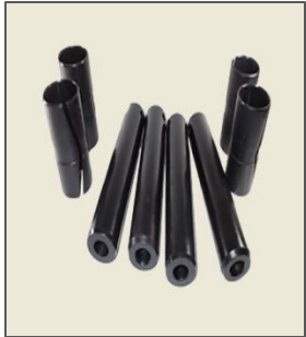
Hinge Pins / Goupilles de charnière / Dobradiça Pins / Pasadores de bisagra