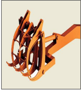
Grabber / Agrippeur / Grabber / Ladrona